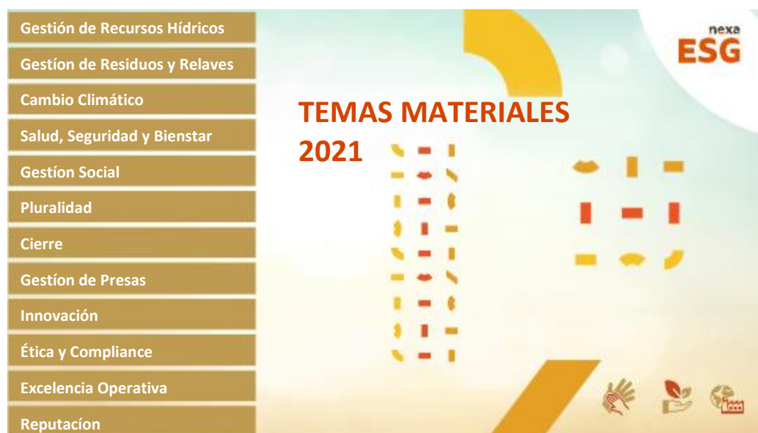
Figura 1 - Temas Materiales

Los indicadores y la información presentes en el Informe Anual 2021 se someten a un proceso de verificación limitada por parte de PricewaterhouseCoopers. Este proceso tiene como objetivo emitir una opinión acerca de las informaciones de sustentabilidad contenida en el Informe.